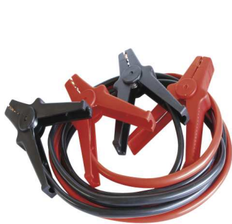
56329 + 56336 + 56343