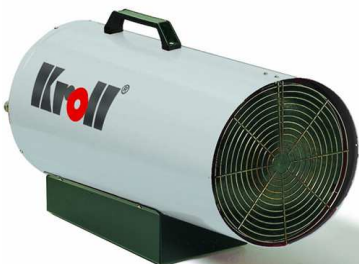
Lieferung in "rot"-lackiert

Der Kroll Gasheizgerät ist ... umweltverträglich er verbrennt fast rückstandsfrei. ... wirtschaftlich er hat einen hohen Wirkungsgrad. Es kann ein Raumthermostat mitgeliefert werden. ... technisch ausgereift er hat einen Druckregler, die Anschlußarmatur gehört zum Lieferumfang. Nach DIN 30697 und somit der Europeanorm CE. ... sicher Die Flamme wird durch Thermolemente überwacht. Die Gaszufuhr stoppt sofort, wenn die Flamme erlischt und der Thermostat verhindert ein Überhitzen. ... wartungsfreundlich Technik und Qualität sichern störungsfreien Betrieb. ^