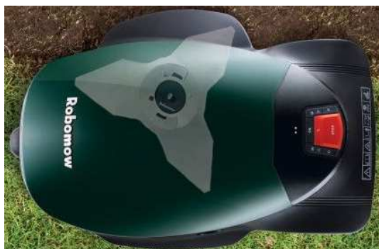
RC306 + RC312