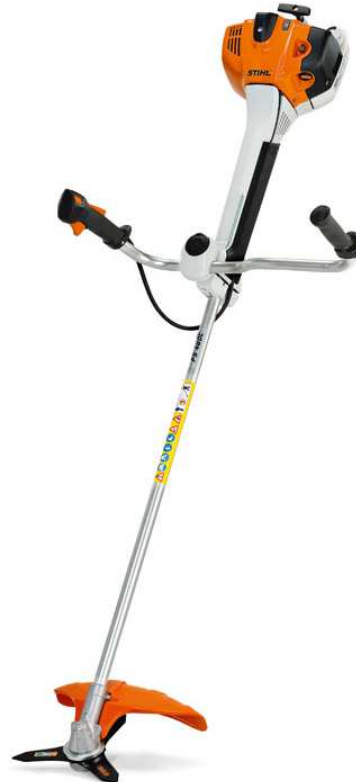
FS360CE - FS410CE - FS460CE

FS310 Leichter, besonders leistungsstarker Freischneider für Mäharbeiten in verfilztem Gras und Gestrüpp. Vereinfachter Startablauf für komfortables Starten, Zweihandgriff, Bediengriff mit Stoptaster, 4-MIX®-Motor, wartungsfreies Getriebe, starre Antriebswelle, mit Universalgurt ADVANCEPLUS. FS360CE Komfortabler, langlebiger, robuster und ergonomisch verbesserter 1,7kW-Freischneider. Mit 2-MIX-Motor, ErgoStart und vereinfachtem Startvorgang. Ideal für Mäharbeiten in zähem Gras. FS410CE Für Mäharbeiten in zähem Gras. STIHL 4-Punkt-Antivibrationssystem, STIHL ErgoStart, Multifunktionsgriff, Zweihandgriff, werkzeuglose Griffeneinstellung, 2-MIX-Motor, STIHL M-Tronic. FS460CE Sehr starker, komfortabler, langlebiger, robuster 2,2kW-Freischneider. Ergonomisch verbessert. Serienmäßig mit elektronischem Motor-Management M-Tronic, ErgoStart und vereinfachter Startvorgang. Ideal für aufwändige Flächenarbeiten in zähem Gras und für Sägeeinsätze im Forst.