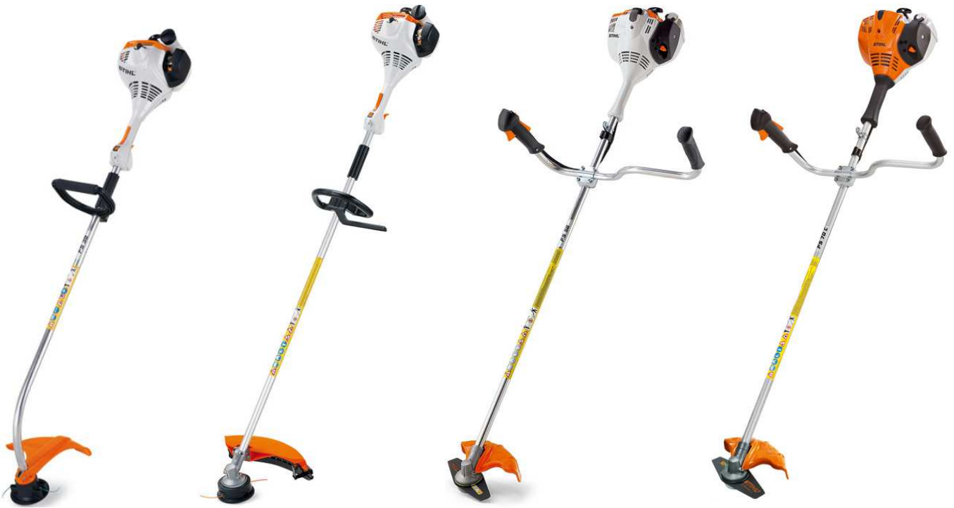
FS38 + FS50